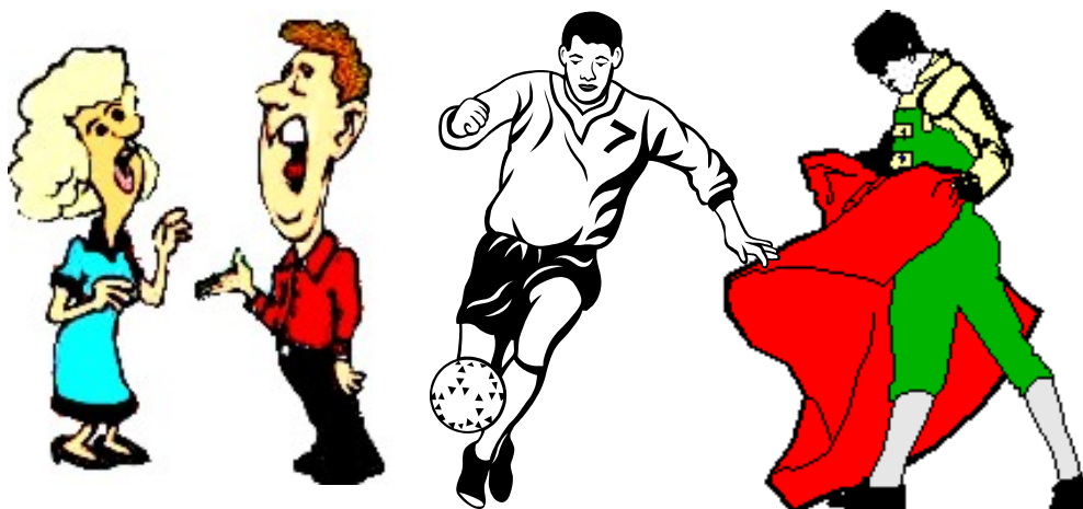
Artistas, jugadores profesionales de fútbol y toreros

c) Además se incluyen los siguientes colectivos: representantes de comercio, artistas, toreros, jugadores profesionales de fútbol, trabajadores ferroviarios.